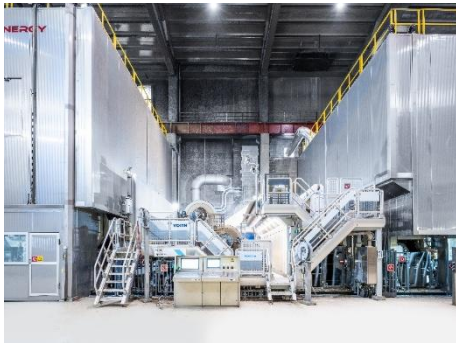
Mondi Duinos neue Wellpappen-Maschine